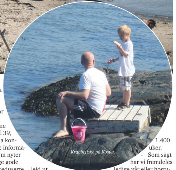
Krabbefiske på Koster.